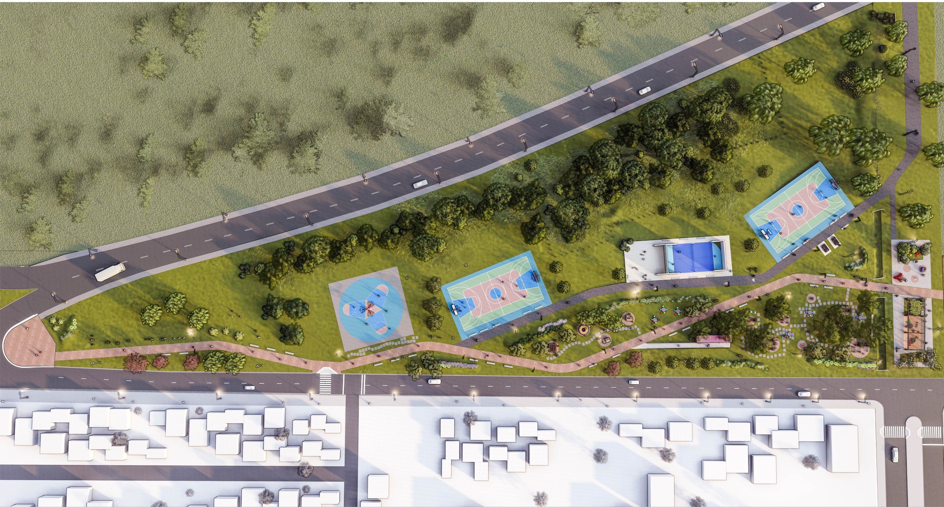
ESQUEMA DE CIRCULACIÓN Y ACTIVIDAD